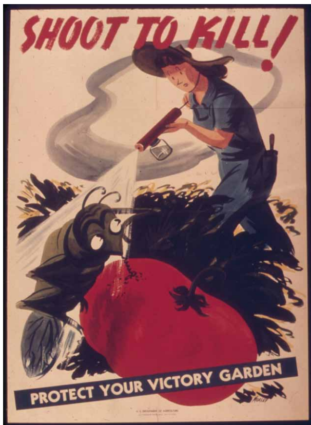
UNE AFFICHE AMÉRICAINE «TIREZ POUR TUER !»

Autrefois, rats, termites, chenilles, puces, pucerons, nématodes, moisissures, plantes adventices faisaient l'objet d'une cohabitation plus ou moins heureuse et tolérée avec la société humaine. Le problème s'est sérieusement corsé avec la sédentarisation et la densification des populations, les plantes cultivées, le stockage des récoltes et la domestication d'animaux, il y a quelque 10 000 ans. Certains témoignages (peintures rupestres du Tassili n'Ajjer, écrits bibliques et égyptiens) font état de fléaux subis par les civilisations de l'époque, avec une mention spéciale aux spectaculaires invasions de criquets pèlerins.