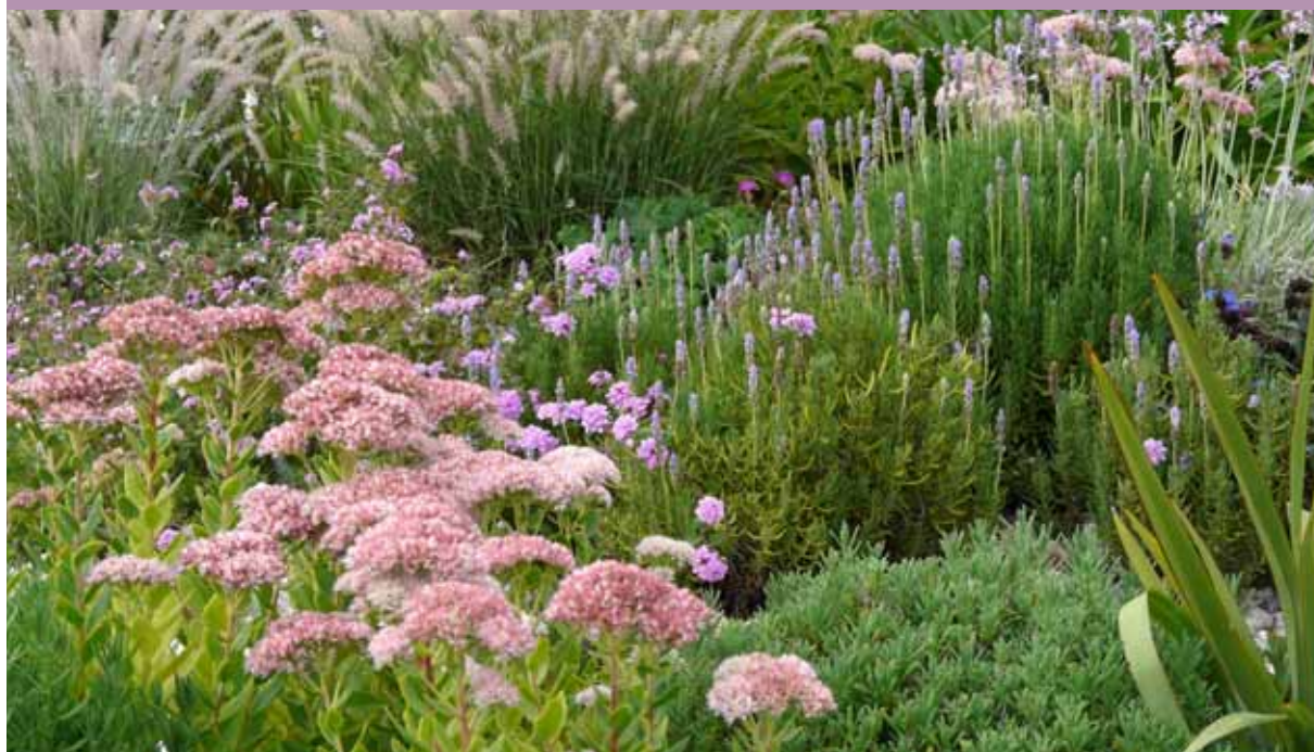
premier prix Concours photo 2009

Société Nationale d'Horticulture de France