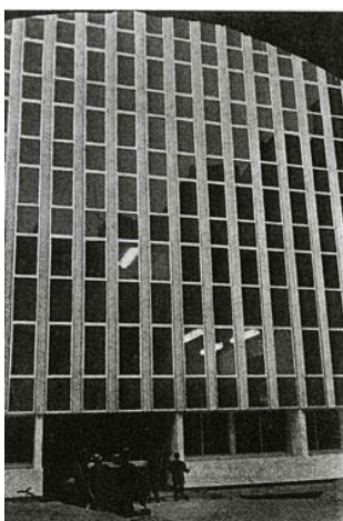
↳ La nouvelle facade de l'immeuble de la SNHF

Un monument dédié aux 145 membres de la SNHF morts pour la France lors de la 1ère guerre mondiale est édifié dans la cour. Il est toujours possible de voir ce monument, patiné par le temps, entouré de trois magnifiques camellias sasanquas, plantés plus tardivement, en 1971. Cet ensemble immobilier perdurera jusqu'en 1970.