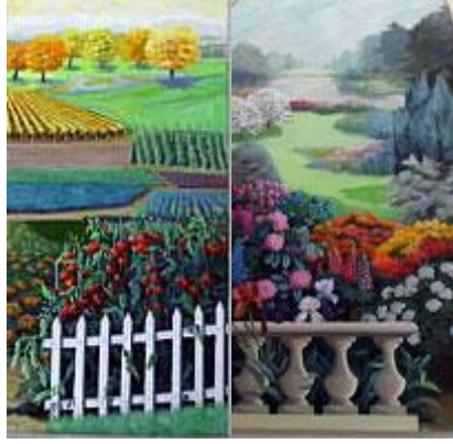
↳ Panneaux peints sous la voûte de la SNHF