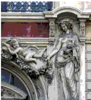
↳ Un détail du porche de la SNHF

L'hôtel de la SNHF est un bel immeuble d'architecture classique. Sa salle à verrières attire beaucoup de monde. Son porche comporte plusieurs sculptures que l'on peut encore, de nos jours, admirer de la rue.