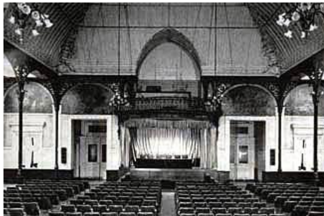
↳ La Salle des Horticulteurs telle qu'elle fut de 1860 à 1970