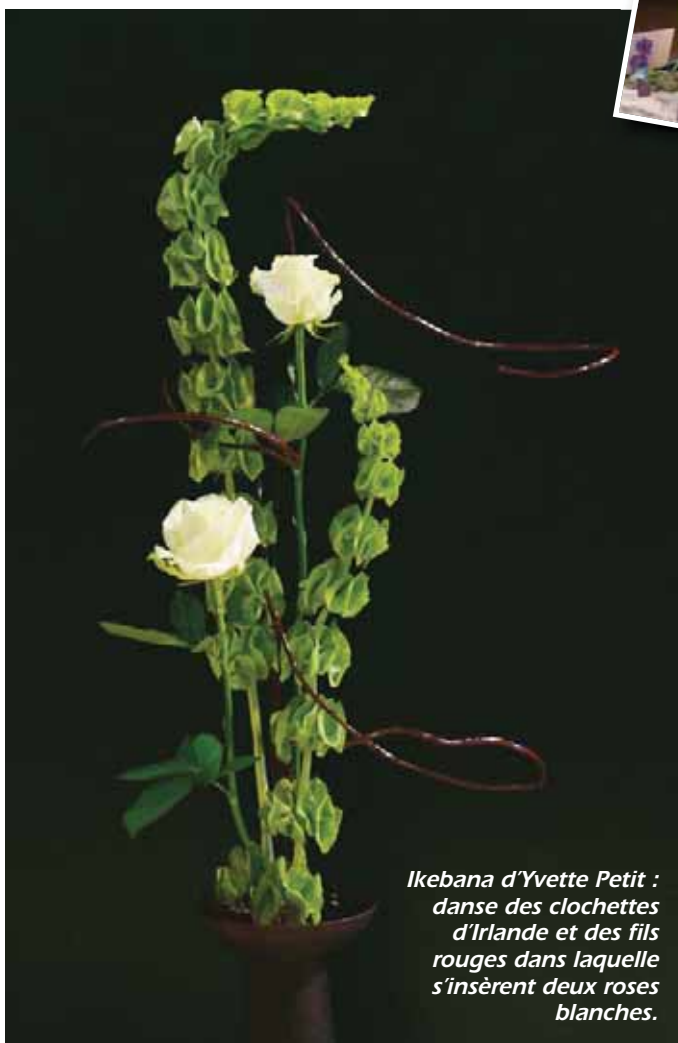
Ikebana d'Yvette Petit : danse des clochettes d'Irlande et des fils rouges dans laquelle s'insèrent deux roses blanches.