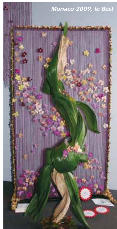
Monaco 2009, le Best