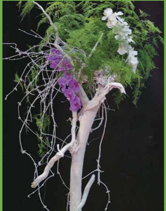
Atelier d'Art floral de Caen, exposition au salon Mon Habitat en mars.