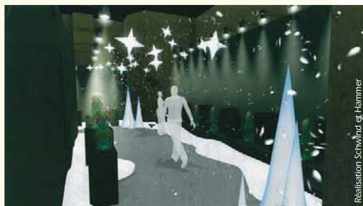
Réalisation Schwind et Hammer