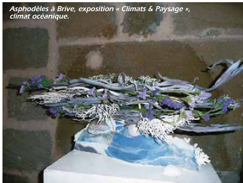
Asphodèles à Brive, exposition « Climats & Paysage », climat océanique.