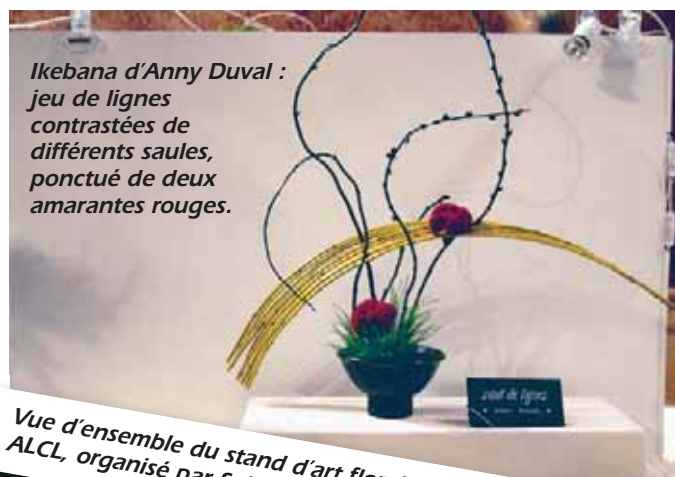
Ikebana d'Anny Duval : jeu de lignes contrastées de différents saules, ponctué de deux amarantes rouges.

Avec des compositions renouvelées tous les trois jours, les stands sont toujours restés beaux, et frais. Aventure terminée... jusqu'aux prochaines Florales, dans cinq ans !