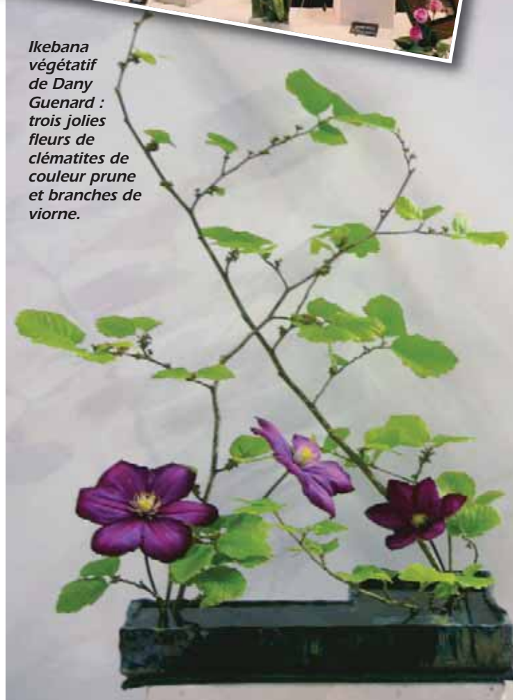
Ikebana végétatif de Dany Guenard : trois jolies fleurs de clématites de couleur prune et branches de violette.