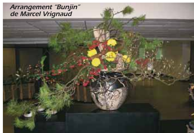
Arrangement "Bunjin" de Marcel Vrignaud