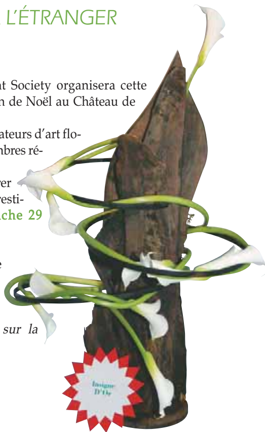
Monaco 2009, Insigne d'or, cat. 7

Pour plus de renseignements sur la BFAS, consultez le site www.bfas.info