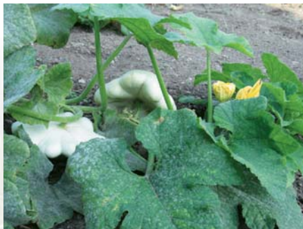
Participant à la diversification alimentaire, les cucurbitacées (ici, un pâtisson) sont mises à l'honneur dans les potagers contemporains.

A l'instar des espaces d'agrément, les jardins utilitaires renouent volontiers avec la tradition, les réalisations d'antan servant de modèles à celles d'aujourd'hui. Ainsi, plusieurs jardins de "simples" d'inspiration médiévale ont-ils été recréés depuis une vingtaine d'années pour agré-