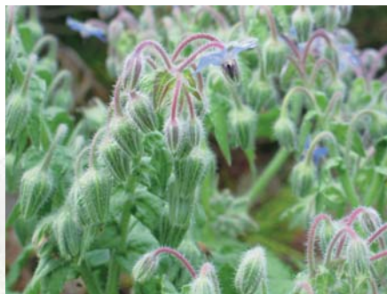
Mellifères, les jolies fleurs de la bourrache attirent les insectes pollinisateurs... et apportent une note colorée dans les salades.

A Saint-Jean-de-Beauregard (Essonne) par exemple, les propriétaires ont restauré le potager dans l'esprit du XVII e siècle. Sur