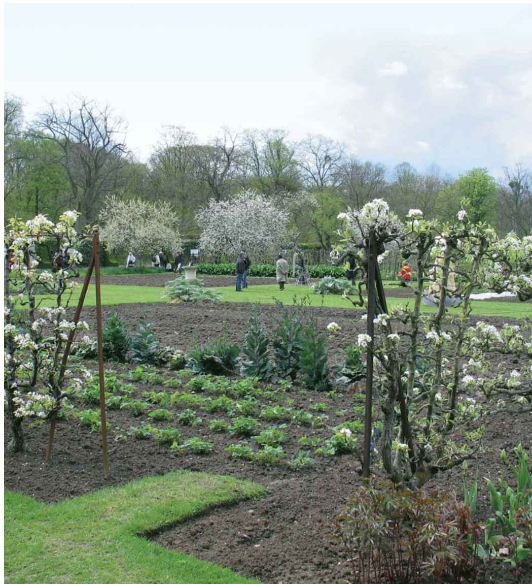
Dans la grande tradition des potagers classiques, celui de Saint-Jean-de-Beauregard est actuellement un des modèles du genre.