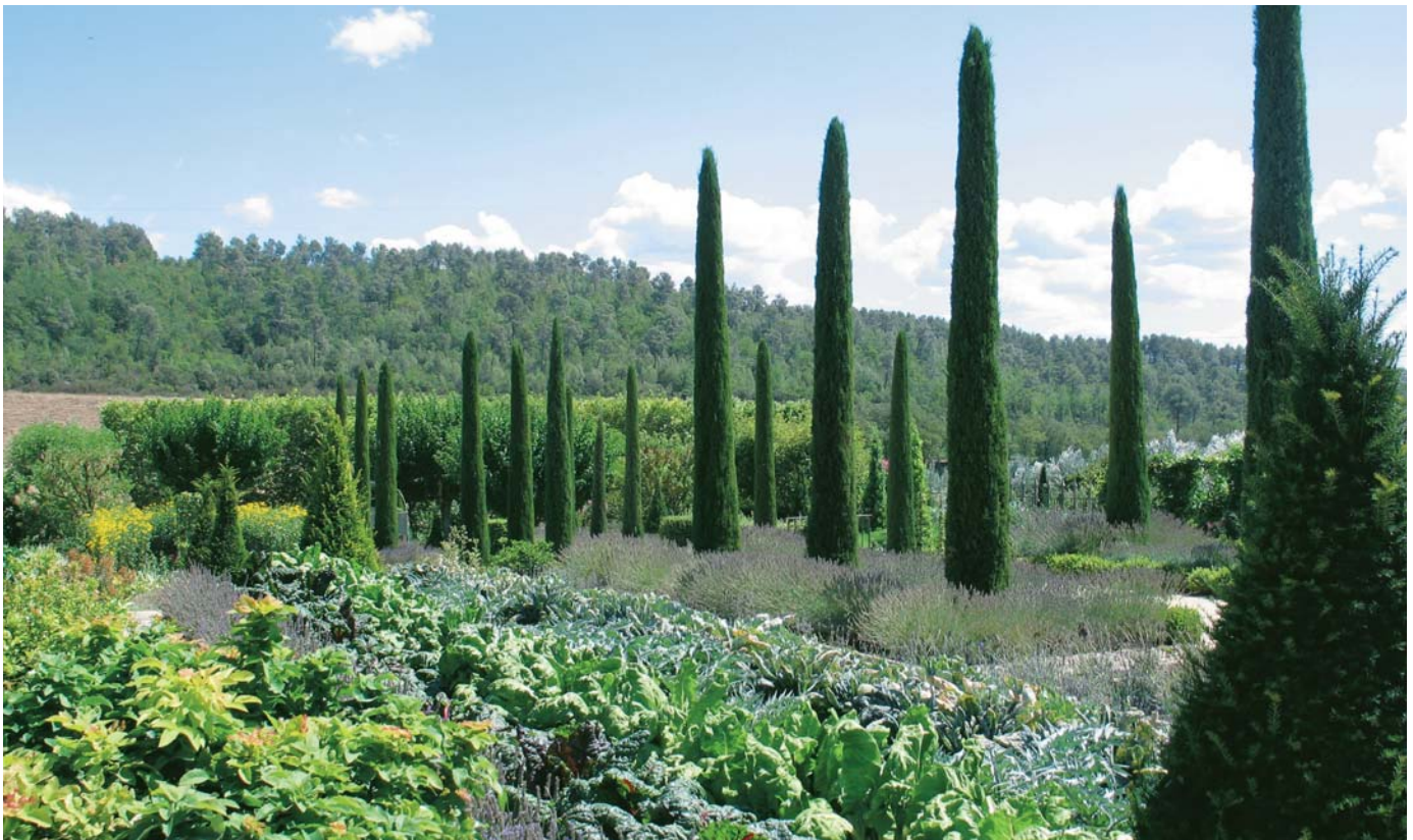
Dans une optique à la fois ornementale et productive, herbes aromatiques, fleurs et légumes se partagent la première terrasse du jardin de Val Joanis (Vauchuse).

A Mens en Isère, Terre vivante illustre parfaitement cette tendance : cette association publie une très intéressante revue 1 et de nombreux livres d'écologie pratique mais applique également ses théories sur le terrain, permettant aux visiteurs de constater de visu leur bien-fondé. Dans son jardin aux multiples facettes, la rotation des plantations, la pratique du mulching ou encore le recours au compost maison permettent d'obtenir légumes, petits fruits et aromates éclatants de santé... le tout sans aucun produit chimique de synthèse.