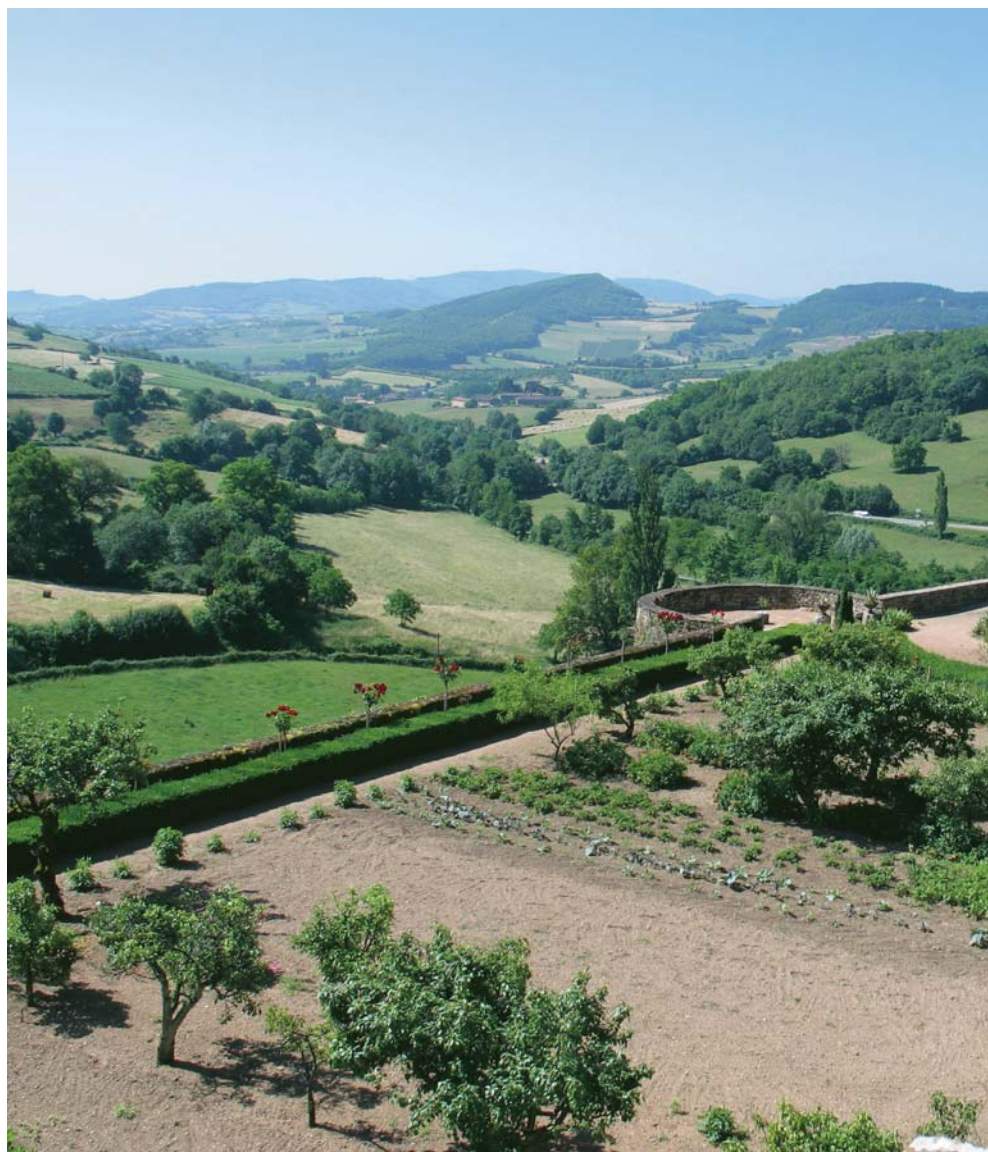
Installé dans l'enceinte d'un château médiéval, le potager de Berzé-le-Chatel (Saône-et-Loire) bénéficie d'une vue somptueuse sur les collines du Mâconnais.