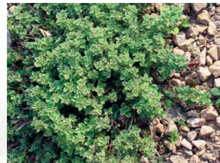
Récemment mis sur le marché, de nombreux cultivars d'herbes aromatiques se parent de feuillages colorés (ici, un origan à feuilles panachées).

En dehors de leur fonction productive – devenue parfois très secondaire – les jardins utilitaires assument d'autres rôles à l'heure actuelle.