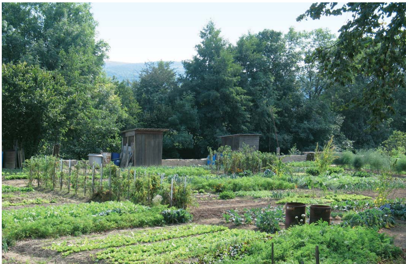
Récemment remis au goût du jour, les jardins familiaux se voient investis d'une véritable mission sociale.