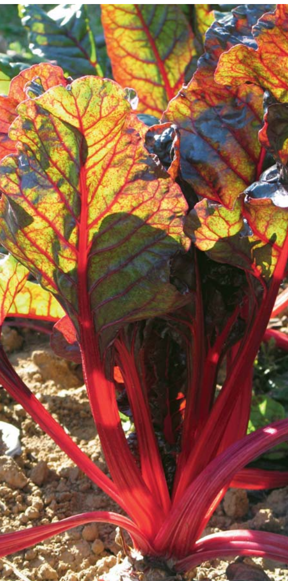
Élégante et savoureuse, la poirée à cardes rouges est, à la fois, utilitaire et décorative.

Issu d'un modèle américain, l'art du potager en carrés permet, quant à lui, d'assurer l'approvisionnement d'une famille tout en réduisant au maximum les contraintes. Adaptée aux modestes superficies actuelles, il s'agit d'une méthode amusante destinée à faire du jardinage un véritable loisir et à susciter d'éventuelles vocations chez les enfants.