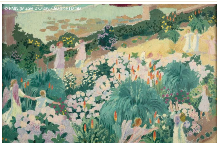
D'une facture très décorative, Le Paradis de Maurice Denis modernise la conception picturale de l'Eden (Maurice Denis, Le Paradis, Paris, Musée d'Orsay).