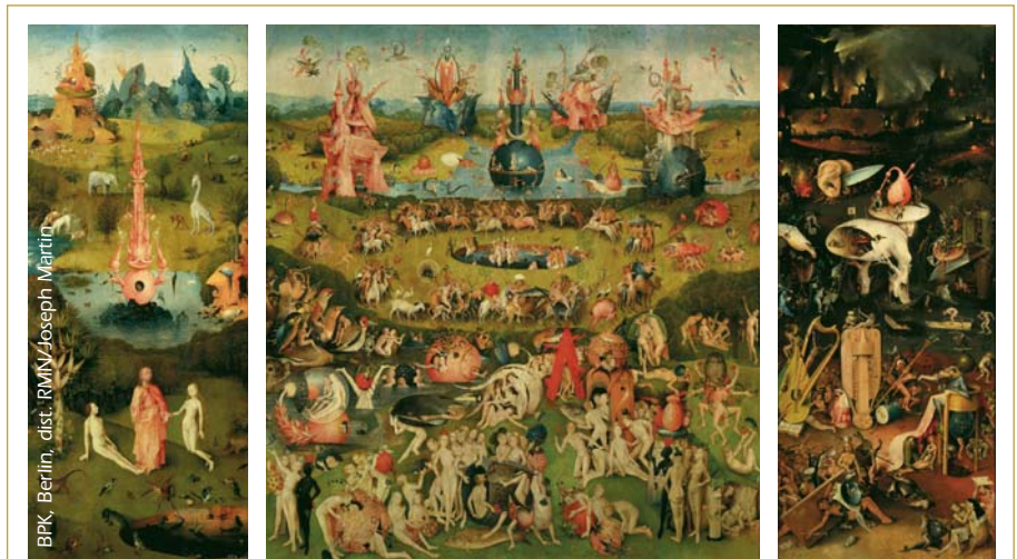
À l'instar des autres tableaux de Jérôme Bosch, le triptyque du Jardin des délices est une œuvre inclassable mêlant tradition chrétienne et fantasmagorie. (Jérôme Bosch, Triptyque du Jardin des Délices, Madrid, Musée du Prado).

L'Eden, archétype de tous les jardins, joue évidemment la vedette. Omniprésent dans les miniatures médiévales et chez les primitifs, il se fait ensuite plus discret mais reste un thème récurrent jusqu'à l'époque contemporaine. Au début du XVI e siècle, Jérôme Bosch en offre, avec Le Jardin des délices , une interprétation très particulière, mêlant êtres humains, ani-