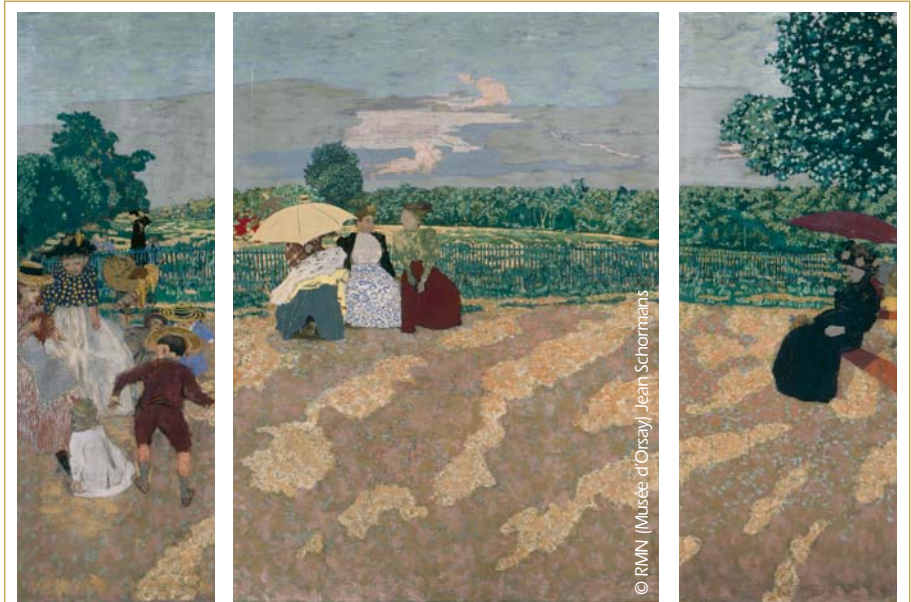
Jeux d'enfants, conversation ou méditation solitaire, Jardins publics de Vuillard traduit bien l'atmosphère, à la fois subtile et contrastée, des lieux. (Édouard Vuillard, Jardins publics : les nourrices, la conversation, l'ombrelle rouge, Paris, Musée d'Orsay).

dans les miniatures médiévales : « carreaux » bien alignés, fontaines gracieuses, végétaux taillés en plateaux, treillis losangés et, parfois même, pavements à motifs constituent un décor élégant pour les rencontres galantes de l'amour courtois. Des jardins bien réels servent même de modèles : ainsi, Émilie dans son jardin , illustration de La Théséide de Boccace attribuée à Barthélemy d'Eyck, reproduit très probablement un des jardins provençaux du Bon Roi René, un amateur éclairé en ce domaine. L'humble courtil, en revanche, a moins inspiré les artistes et se trouve, la plupart du temps, relégué dans les calendriers des livres d'heures ou les traités d'agronomie comme Le Rustican de Pierre de Crescens. Même constat un peu plus tard : les domaines des Médicis à la Renaissance, Versailles, Saint-Cloud et Marly au Grand Siècle ou encore les parcs pittoresques au siècle des Lumières suscitent bien davantage l'intérêt que le modeste jardin vivrier. Il faut attendre l'époque contemporaine pour que ce dernier accède vraiment à la dignité picturale. Et encore... Si le verger bénéficie d'une réelle reconnaissance dès la fin du XIX e et le début du XX e grâce à