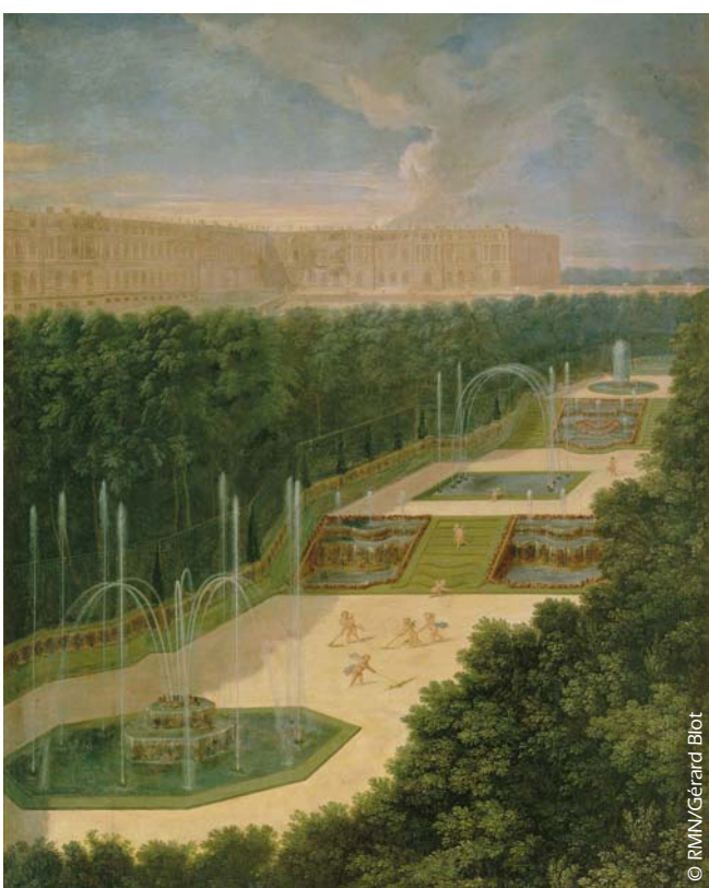
Empreintes de fantaisie mais très précises, les vues des bosquets de Versailles réalisées par Jean Cotelle constituent une excellente source documentaire pour les historiens (Jean Cotelle, Vue du Bosquet des trois Fontaines, Versailles ).

Assez présent – et sous tous ses aspects – dans la peinture, le jardin n'y occupe pas toujours la même place. Dans les tableaux des primitifs flamands, il se trouve souvent relégué à l'arrière-plan, apparaissant par l'ouverture d'un portique ou d'une fenêtre, un procédé pictural mis au point dans la première moitié du XV e siècle et abondamment utilisé par les artistes du nord de l'Europe. C'est le cas dans le célèbre tableau de Jan Van Eyck conservé au Louvre, La Vierge au chancelier Rolin (1435) qui représente, au premier plan, Nicolas Rolin, chancelier du duc de Bourgogne Philippe le Bon, agenouillé dans une loggia face à Marie tenant sur ses genoux l'Enfant Jésus. Par une triple arcature, le tableau s'ouvre sur un jardin clos limité par un parapet crénelé qui constitue un plan intermédiaire entre le paysage du fond et les personnages. Composition similaire dans La Vierge à l'Enfant en compagnie de Marie-Madeleine et d'une donatrice du Maître de la Vue de Sainte-Gudule et dans plusieurs Annonciations.