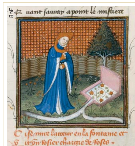
Dans les miniatures comme dans la littérature médiévales, le jardin constitue le cadre privilégié de l'amour courtois (Le Roman de la Rose, Guillaume de Lorris, « Amant apercevant le reflet du rosier dans la fontaine d'amour »).

Il est ainsi le lieu idéal de l'idylle. En déclinant toutes les facettes de la félicité – abondance, jouissance des différents sens, sentiment d'harmonie avec la nature, perfection esthétique – il fait figure d'écrin parfait pour les entreprises de séduction. Dans la littérature médiévale, par exemple, le « verger » semble presque indissociable de l'amour courtois ce qui explique l'abondance des miniatures illustrant une scène amoureuse dans un jardin. À l'inté-