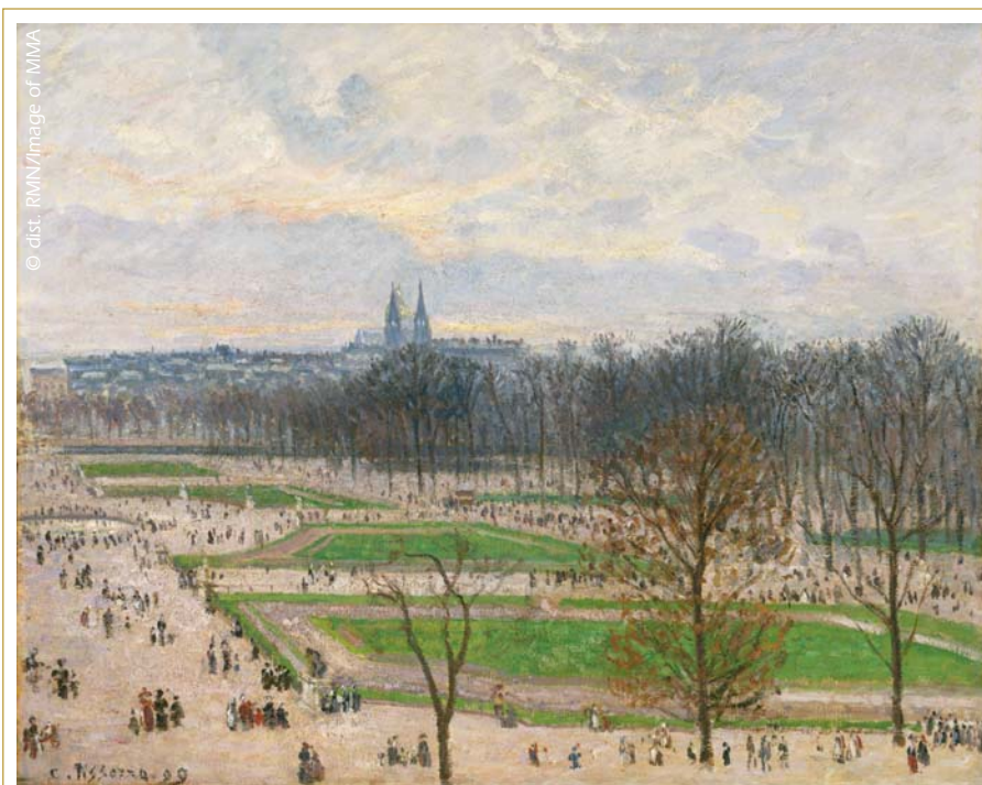
Créés au XIX e siècle, ou d'origine plus ancienne comme les Tuileries, les parcs urbains ouverts au public inspirent volontiers les artistes (Camille Pissarro, Le Jardin des Tuileries un après-midi d'hiver, New-York, The Metropolitan Museum of Art).

Apparus à l'époque du Second Empire, les jardins publics, en revanche, deviennent très vite une source d'inspiration importante. Lieux de rencontre mais aussi espaces de diversité où se côtoient ouvriers et bourgeois, enfants et personnes âgées, familles et individus solitaires, ils captivent nombre d'artistes qui tentent d'en traduire les atmosphères subtiles et contrastées. Du Jardin des Tuileries de Camille Pissarro au parc Monceau peint par Claude Monet en passant par le square Vintimille qui inspire à Édouard Vuillard (habitant alors rue de Calais, à proximité) plusieurs tableaux, les exemples se multiplient. L'un des plus connus reste sans doute, du même Vuillard, l'ensemble en cinq panneaux intitulé Jardins publics destiné à décorer la salle à manger d'Alexandre Natanson, fondateur de la Revue Blanche .