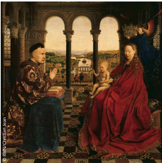
Bien que relégué à l'arrière-plan, le jardin clos figuré dans La Vierge au chancelier Rolin de Jan Van Eyck joue un rôle important dans le registre de la symbolique (Jan Van Eyck, La Vierge au chancelier Rolin , Paris, Musée du Louvre).