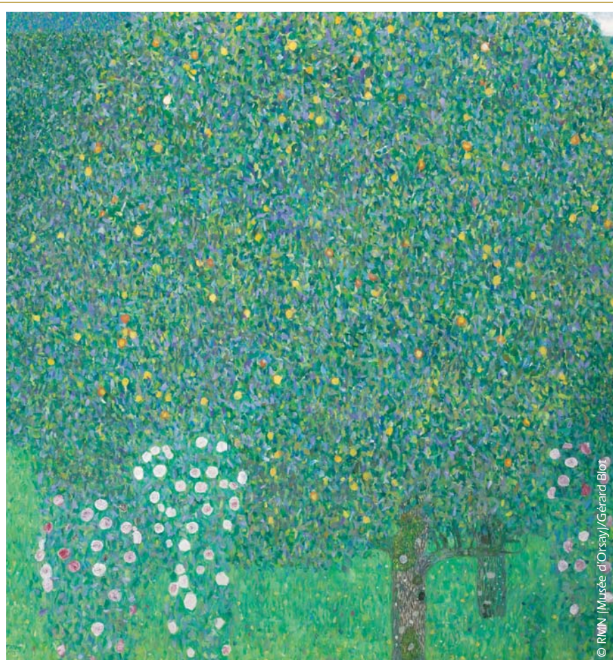
Avec sa juxtaposition de touches colorées qui emplissent presque toute la toile, Rosiers sous les arbres de Gustav Klimt offre une vision inédite du jardin (Gustav Klimt, Rosiers sous les arbres, Paris, Musée d'Orsay).

Le changement apparaît chez nos voisins d'outre-Manche qui, à l'instar de William Kent puis de Lancelot « Capability » Brown, conçoivent désormais leurs parcs à l'imitation des œuvres de Claude Lorrain, Nicolas Poussin ou Gaspard Dughet. Les grandes réalisations de l'époque – Stowe ou Stourhead parmi d'autres – se présentent ainsi comme une succession de tableaux tridimensionnels. Très apparent sur le terrain, ce « picturalisme » se retrouve aussi dans les écrits théoriques, ceux d'Alexandre Pope par exemple qui n'hésite pas à affirmer que « tout l'art des jardins relève de la peinture de paysage ». La terminologie elle-même s'inspire largement du vocabulaire pictural : « ta-