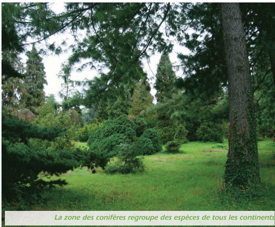
La zone des conifères regroupe des espèces de tous les continents.

Créée en 1867 à la demande du Baron Haussmann, l'École Du Breuil fut mise en place sur son site actuel lors de la première Exposition coloniale. C'est la plus ancienne école d'horticulture française. Dépendant de la Mairie de Paris, elle forme les maîtres jardiniers de la capitale mais aussi les futurs professionnels de l'horticulture et du paysage de nombreuses villes ou entreprises privées. Les formations initiales ou continues permettent d'obtenir des diplômes variés niveaux brevet, Bac, technicien supérieur ou licence. Une formation pour les futurs spécialistes de l'élagage vient aussi d'être créée cette année.