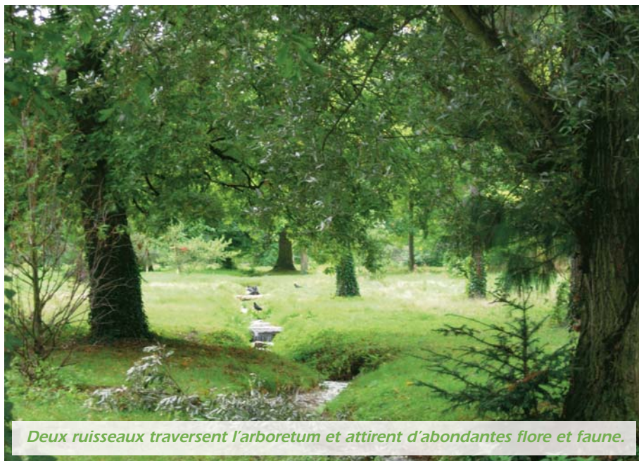
Deux ruisseaux traversent l'arboretum et attirent d'abondantes flore et faune.

Aujourd'hui, plus de 1260 arbres répartis en 500 taxons (dont 15 menacés au sens de l'Union internationale de conservation de la nature - UICN) poussent sur 12 ha. La plupart des essences ont été regroupées par genre (chênes, hêtres, tilleuls...) Les conifères sont répartis autour de la zone centrale symbolisée par un Sequoia sempervirens . Le grand nombre d'espèces nécessiterait cependant une meilleure lisibilité pour un public non averti. « Nous réfléchissons à des promenades thématiques et à des aménagements paysagés qui rendront le site plus lisible » confie Eric Demerger. Une telle richesse n'est en effet surtout intelligible que par les élèves et les spécialistes. Plusieurs projets sont cependant en cours : réorganisation des zones humides, aménagement de l'étang, plantation de haies bocagères, organisation d'expositions... les projets et les possibilités sont immenses pour une meilleure mise en valeur de ces richesses méconnues. ■