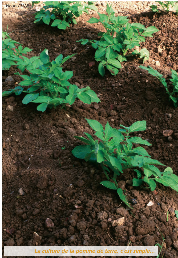
La culture de la pomme de terre, c'est simple...