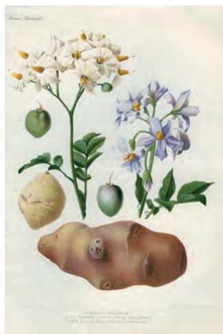
Revue Horticole (fonds documentaire de la SNHF).

La pomme de terre fut introduite en Europe au XVI e siècle par les Espagnols, de retour de leurs nouvelles colonies américaines. Bien qu'elle fasse son apparition en France dès 1540, il faudra attendre 1747 pour que les cultures et l'usage pour la consommation humaine se développent, tout d'abord en Bretagne, sous l'influence de Louis-René de Caradeuc de La Chalotais, bientôt suivi par Monseigneur de la Marche, surnommé "l'évêque des patates". Mais c'est surtout Antoine-Augustin Parmentier qui, après l'avoir découverte dans les geôles prussiennes où elle était la principale nourriture fournie