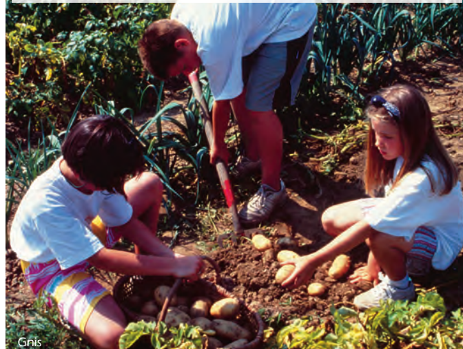
La pomme de terre, une affaire de famille.

La meilleure façon de consommer ce tubercule est de le faire cuire à la vapeur dans sa peau pour conserver toutes ses vitamines et de le cuisiner rapidement après l'achat ou la récolte au jardin.